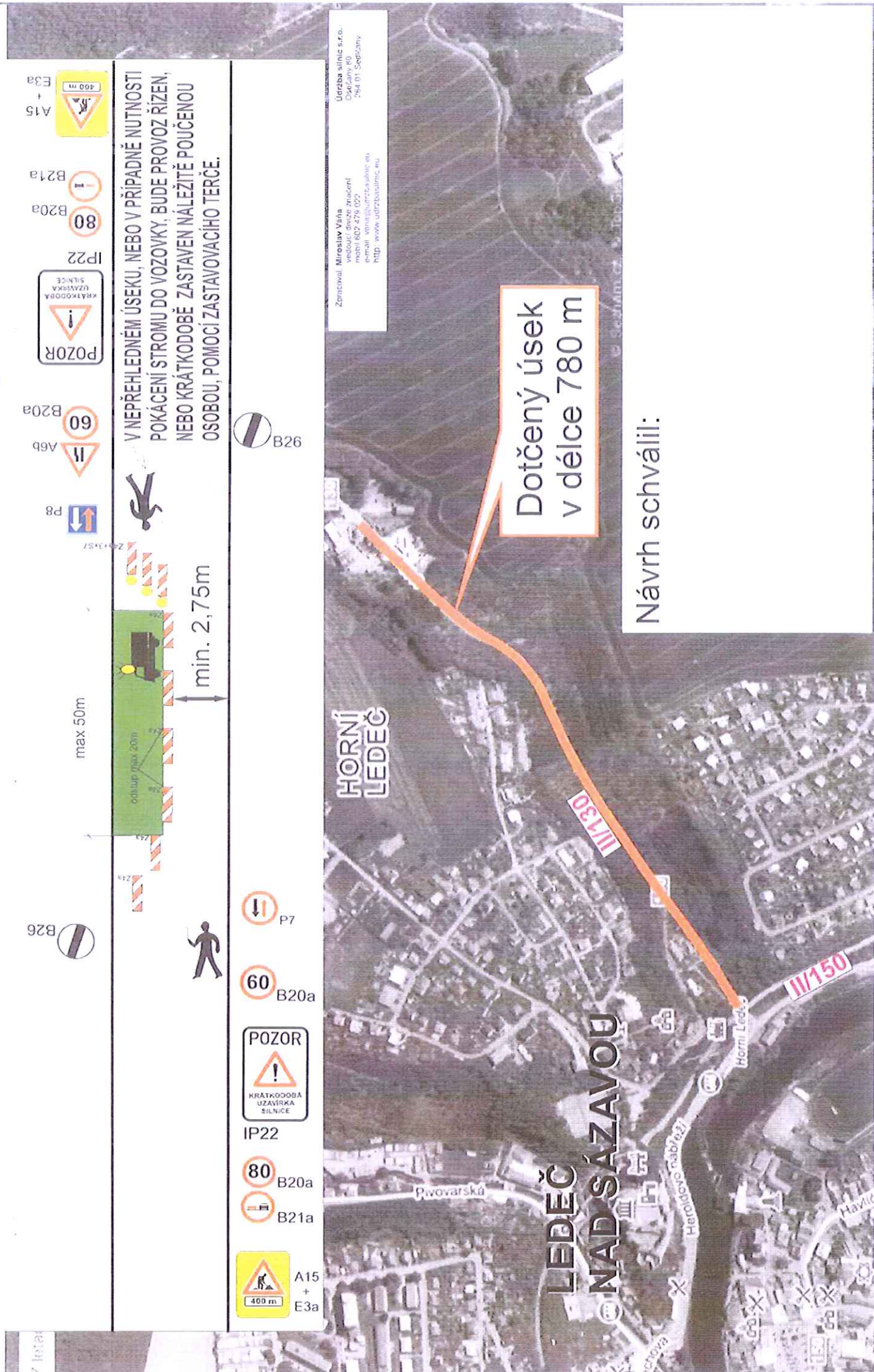
Schéma dopravního značení - přechodná úprava provozu na silnici č. I/130 v úseku Leděč nad Sázavou - Hradec, z důvodu kácení porostu.